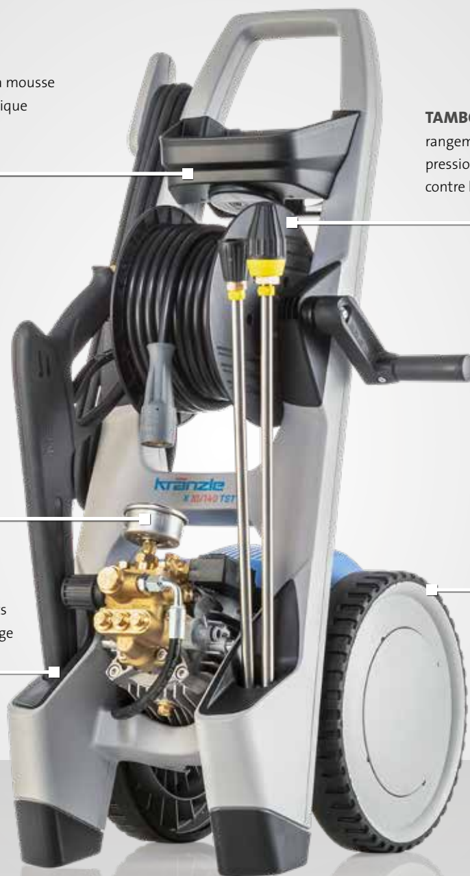
Fig : X10/140 TST | 603610

châssis robuste avec roues de grand diamètre pour un transport facile et une grande stabilité