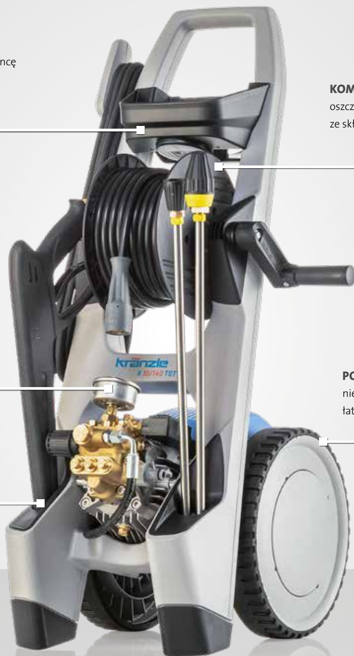
Rys: X 10/140 TST | 603610

niezwykle wytrzymałe podwozie dla łatwego transportu i wysokiej stabilności